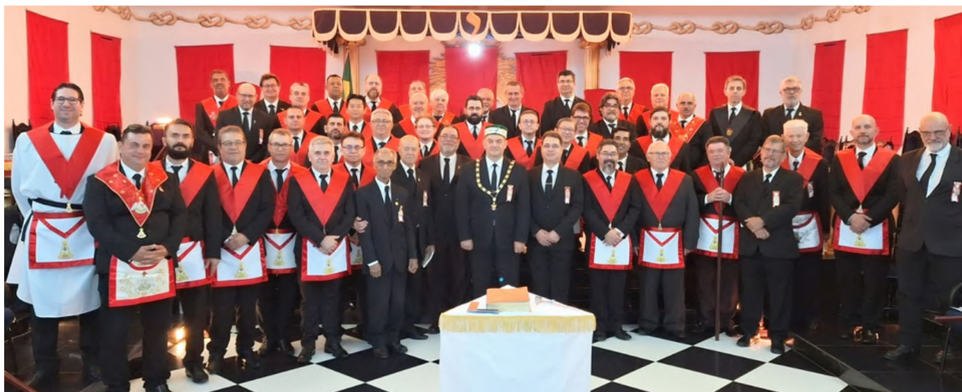
3ª Região Litúrgica do Paraná - Iniciação Grau 18 em 05/10/2023