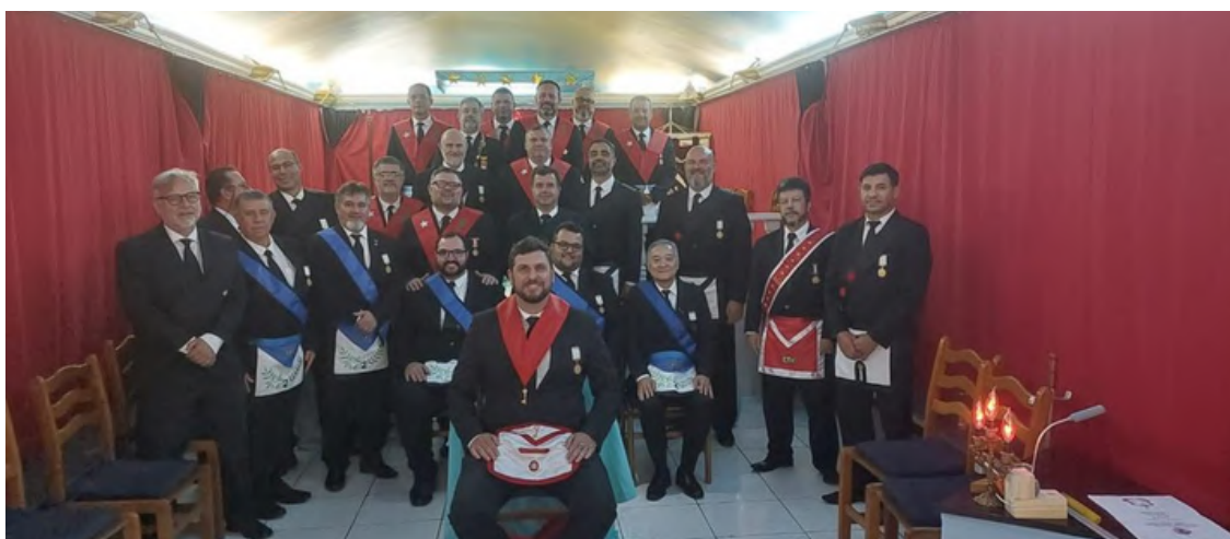
ELP Cavaleiros da Chave de Marfim