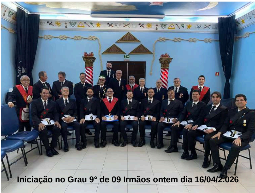
Iniciação no Grau 9º de 09 Irmãos ontem dia 16/04/2.026