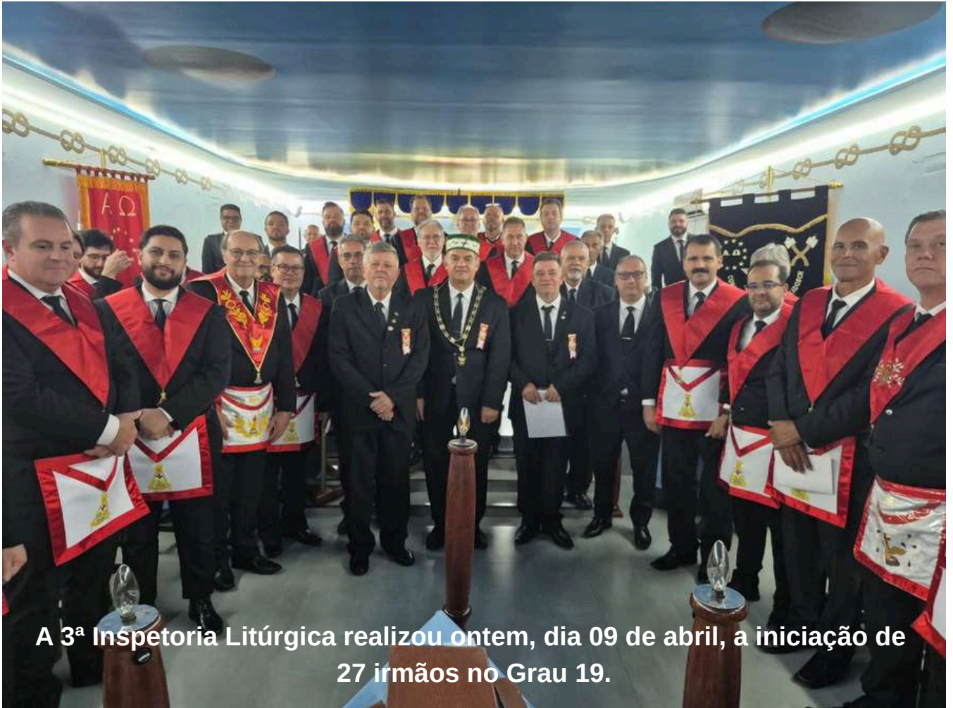
A 3ª Inspetoria Litúrgica realizou ontem, dia 09 de abril, a iniciação de 27 irmãos no Grau 19.