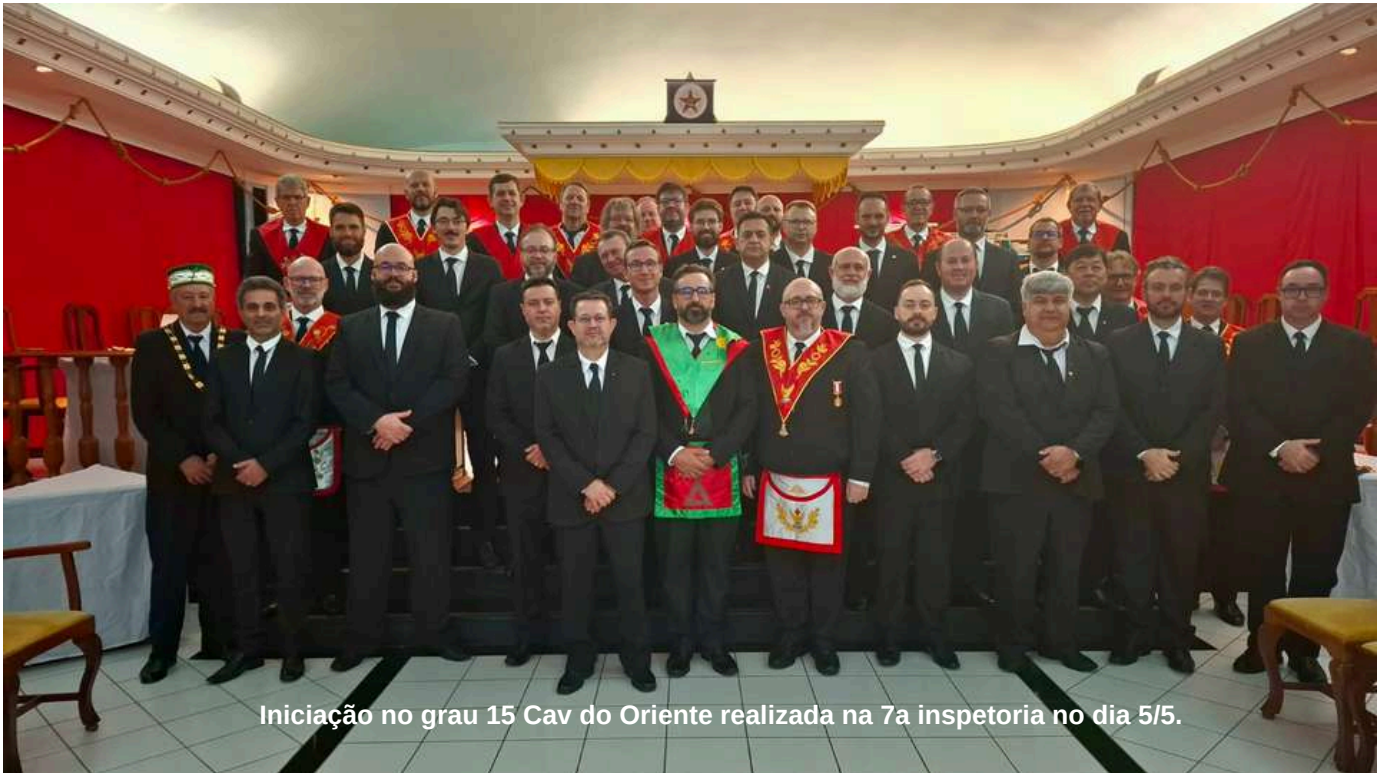
Iniciação no grau 15 Cav do Oriente realizada na 7a inspetoria no dia 5/5.