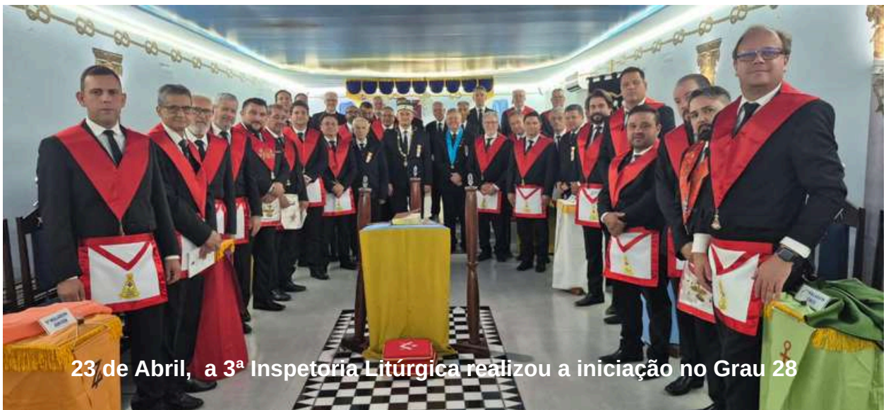
23 de Abril, a 3ª Inspetoria Litúrgica realizou a iniciação no Grau 28