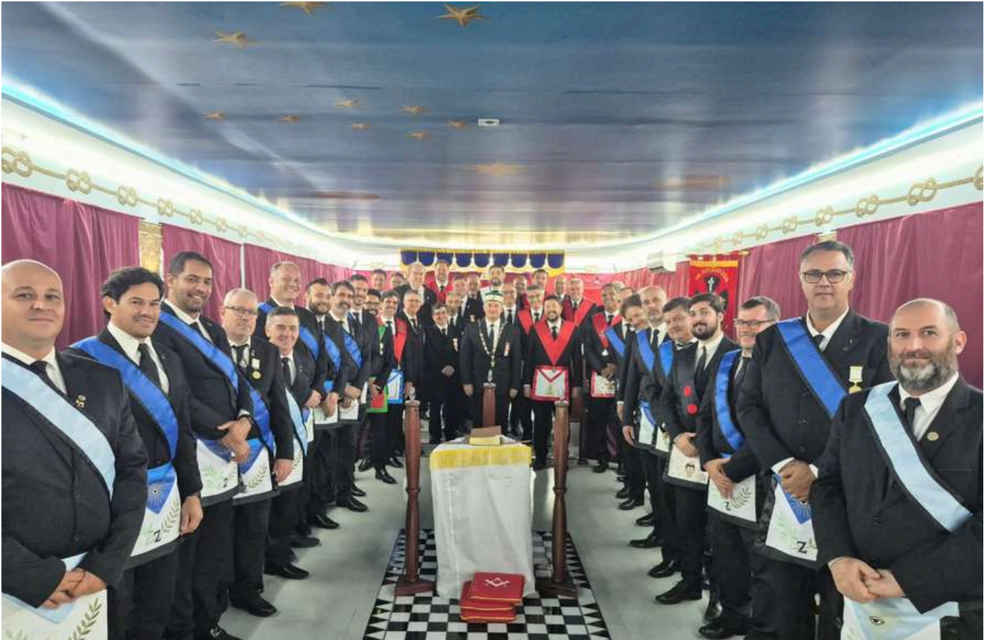
A Inspetoria Litúrgica da 3ª Região realizou no dia 07 de maio, a Cerimônia de Iniciação do Grau 15