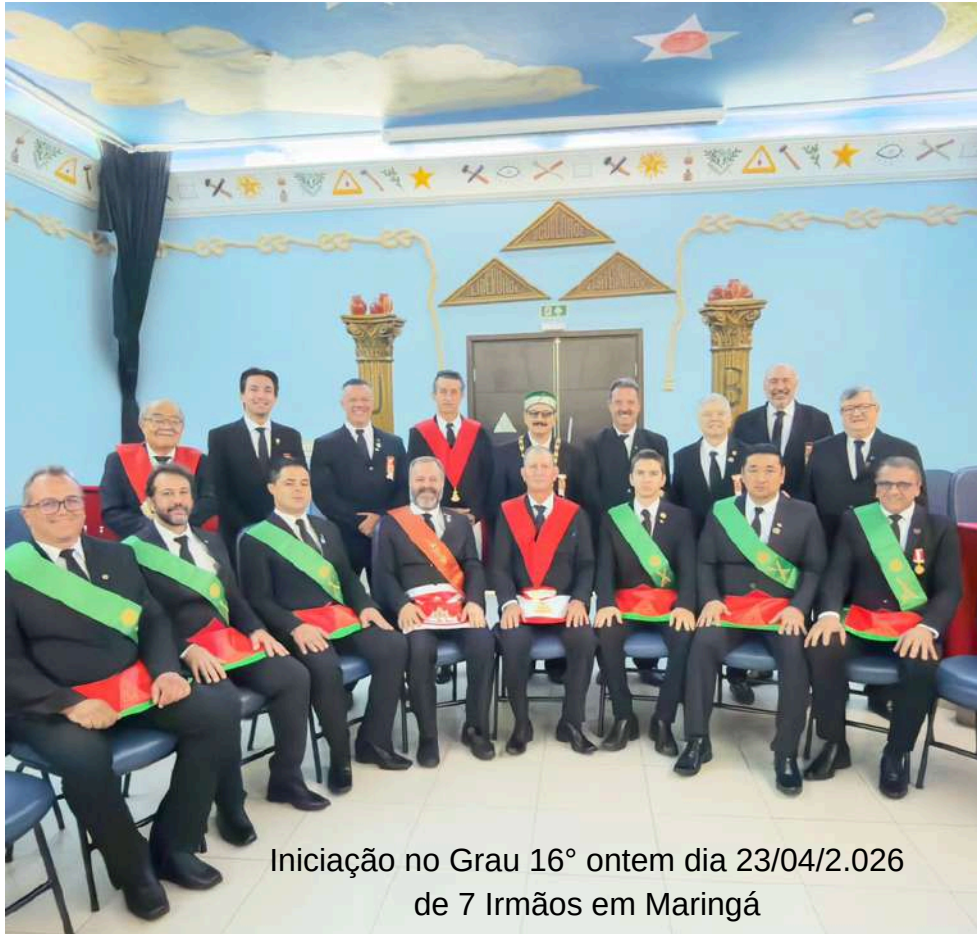
Iniciação no Grau 16º ontem dia 23/04/2.026 de 7 Irmãos em Maringá