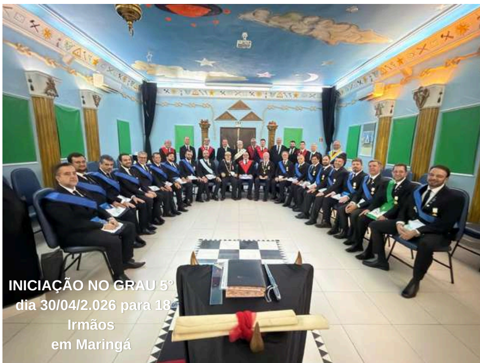
INICIAÇÃO NO GRAU 5º dia 30/04/2.026 para 18 Irmãos em Maringá